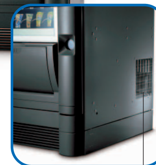
Varmluftsudgang på sidepanel