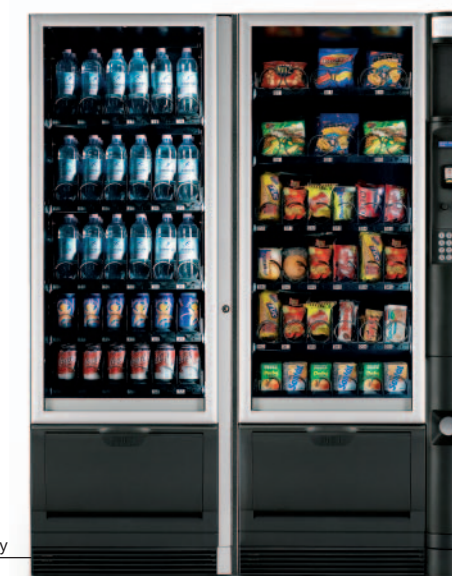
Snakky SL og Snakky

Hvis der er behov for en ekstra stor kapacitet kan Snakky placeres ved siden af en Snakky SL, som svarer til en Snakky men uden betalingssystem. V.h.a. et master/slave-kit deler de to automater betalingssystemet og valgpanelet, som er placeret på Snakkyen.