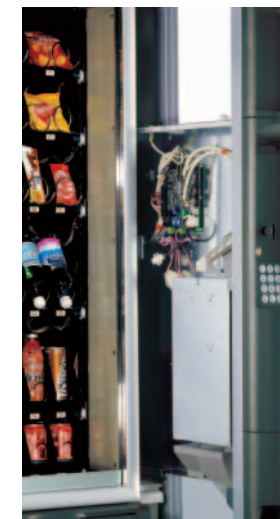
Separat enhed med uafhængig adgang til betalingssystem og elektronik

Snakky har et ergonomisk og vandalsikkert produktudleveringsrum (patenteret) med mulighed for blokering, når der ikke handles. Købte produkter er lette at tage op, og grundet en dæmper lukker det robuste udleveringsrum sig langsomt bagefter. Den nye skub-ind-/træk-ud-køleenhed kræver minimal vedligeholdelse og er nem at udtage. Betalingssystem og elektronik er placeret i en separat udtrækkelig enhed med uafhængig adgang, så automaten kan serviceres i dette område uden at temperaturen i produktområdet ændres.