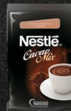
NESTLÉ CACAO MIX

En intens kakaosmag med mellem-lang eftersmag med en tone af rosin og modne blomster.