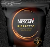
NESCAFÉ RISTRETTO Skarp & intens

Skarp og bitter på den syditalienske måde med en kraftig og blivende eftersmag med toner af citrusskal, grapefrugt, druer og nødder.