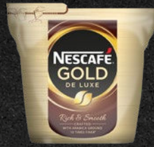
NESCAFÉ GOLD DE LUXE Frugtig og sofistikeret

Modne røde æbler, lys chokolade, nougat og nødder. En elegant og velfabuleret kaffe, som kan drikkes hver dag – morgen, middag og aften, år efter år.