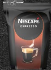
NESCAFÉ ESPRESSO Frisk og mild

Blå druer, søde blomster eller mellemrød chokolade. En fyldig og frisk kaffe, som dufter af frisk rug og har en lang og meget behagelig eftersmag af ahornsirup. 100% Arabica.