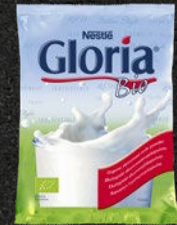
NESTLÉ GLORIA BIO SKUMMETMÆLKSPULVER

Gloria Bio er et økologisk skummetmælkspulver og består af 100 % mælk, helt uden tilsætningsstoffer, fra certificerede økologiske landbrug