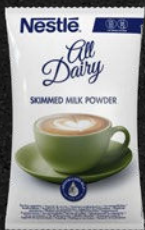
NESTLÉ SKIMMED MILK

Nestlé Skimmed Milk All Dairy består af 100 % mælk helt uden tilsætningsstoffer.