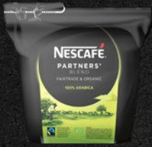
NESCAFÉ PARTNERS' BLEND Frisk og urteagtig

Frisk og krystallklar karakter med toner af sød-syrlige citrusfrugter, grønne druer og røde lyse bær. En let pirrende og behagelig kaffe med en eftersmag med toner af lys chokolade. 100 % Arabica.