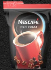
NESCAFÉ RICH ROAST Røget & bittersød

Røget med toner af kakao, mørk bitter chokolade og bittermandel. En mørk og udfordrende kaffe med nuancer af skovhonning i den ekstremt lange og tydelige eftersmag.