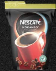
NESCAFÉ MOKAMBO TRADICIÓN Nøddeagtig og krydret

Nøddeagtig og sød med toner af ren kakao, ristet brød og krydderkrage. Rig smag med afsluttende toner, der leder tankerne hen på mørk bitter chokolade.