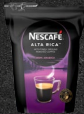
NESCAFÉ ALTA RICA Sød og orientalsk

Mørk og sød med toner af kakao og røde, friske bær. En meget kompleks og fyldig kaffe med afsluttende toner af orientalske krydderier. 100% Arabica.